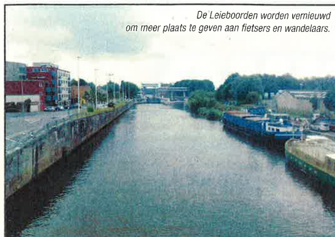
De Leieboorden worden vernieuwd om meer plaats te geven aan fietsers en wandelaars.

Ook voor de bedrijven langs de Leie werd een oplossing gezocht en gevonden. “Onder andere voor de firma Ver-