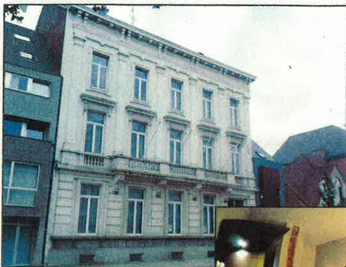
Wordt het oude politiekantoor binnenkort een hotel?