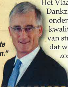
GEERT BOURGEOIS, viceminister-president van de Vlaamse Regering

"Er ligt een hervorming op tafel die het goede van het Vlaamse onderwijs behoudt en tegelijk de knelpunten wegwerkt met concrete maatregelen."