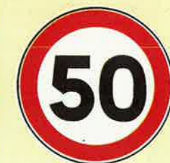
Te hoge snelheid in Stasegem