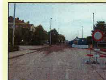
Werken N43 van start