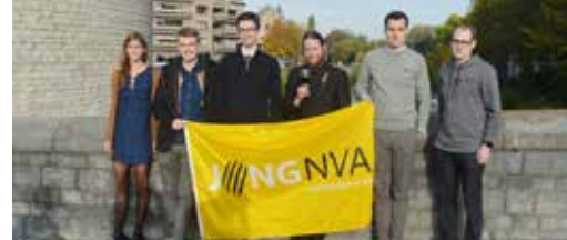
Jong N-VA Vivit gaat ertegenaan! p. 3