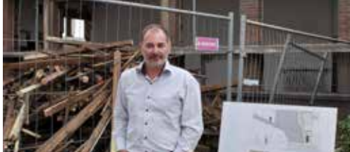
Academies verder uitbouwen p. 2