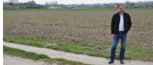
Inzetten op trage wegen p. 3