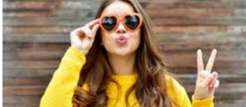
Jonge talenten aan het woord p. 2